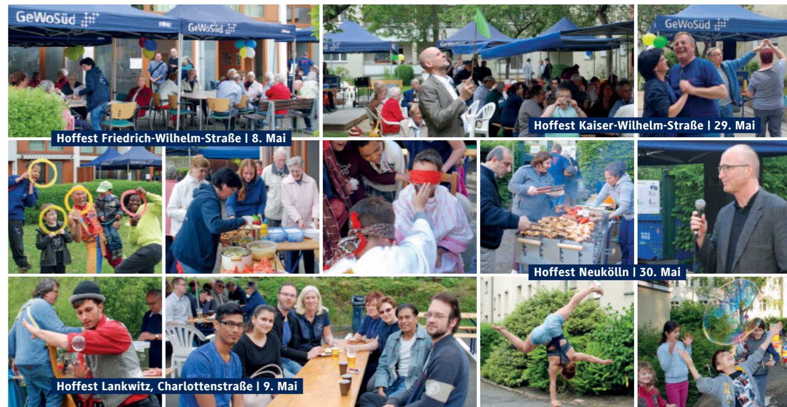
Hoffest Friedrich-Wilhelm-Straße | 8. Mai

Robert Edler von Musil (1880–1942), österreichischer Novellist, Dramatiker und Aphoristiker