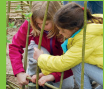
Weidentunnel > Seite 10