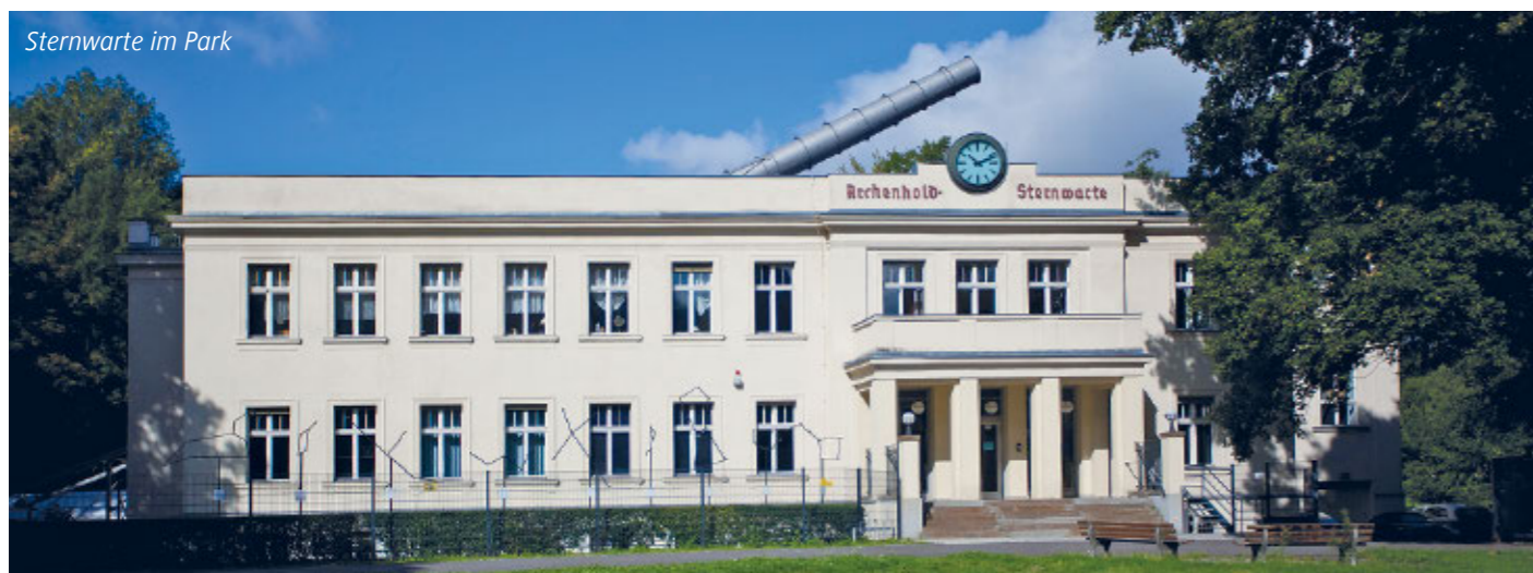
Sternwarte im Park