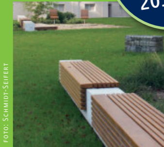
Grüne Oasen > Seite 8