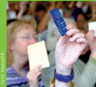
Mitgliederversammlung > Seite 5

Für Geschwister gibt es weitere Stundenpläne in der GeWoSüd-Geschäftsstelle (nur solange der Vorrat reicht)