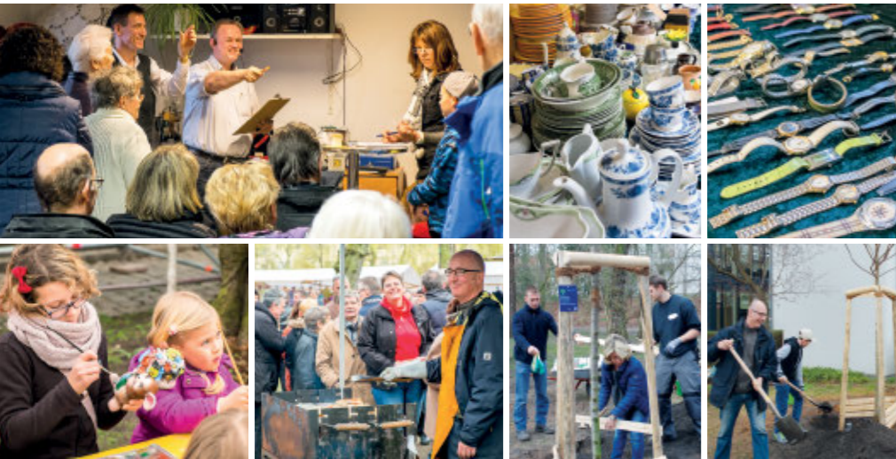
OSTERMARKT IM LINDENHOF AM 28. MÄRZ 2015