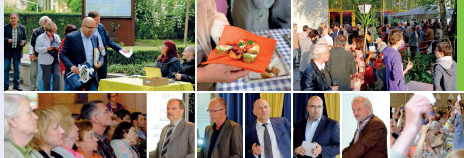
GEWoSÜD MITGLIEDERVERSAMMLUNG 2015