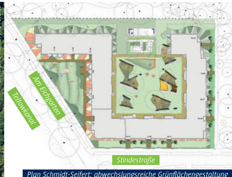
Plan Schmidt-Seifert: abwechslungsreiche Grünflächengestaltung