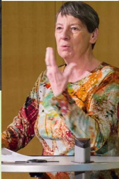
Dr. Barbara Hendricks, Bundesministerin für Umwelt, Naturschutz, Bau und Reaktorsicherheit

Die Auszeichnung zum UN-Dekade-Projekt findet im Rahmen der Aktivitäten zur UN-Dekade Biologische Vielfalt statt, die von den Vereinten Nationen für den Zeitraum von 2011 bis 2020 ausgerufen wurde. Ziel der internationalen Dekade ist es, den weltweiten Rückgang der biologischen Vielfalt aufzuhalten. Dazu strebt die deutsche UN-Dekade eine Förderung des gesellschaftlichen Bewusstseins in Deutschland an. Der Begriff „biologische Vielfalt“ bezeichnet das gesamte Spektrum des Lebens auf der Erde. Damit sind die Vielzahl aller Tiere, Pflanzen, Mikroorganismen und Pilze sowie die genetische Vielfalt innerhalb dieser Arten gemeint. Aber auch ihre verschiedenen Lebensräume und die komplexen ökologischen Wechselwirkungen sind Teil der biologischen Vielfalt. Seit Jahrzehnten ist ein Rückgang dieser Vielfalt zu beobachten. Damit schwindet auch für uns Menschen die wertvolle Lebensgrundlage. Das Anliegen der UN-Dekade Biologische Vielfalt ist es daher, mehr Menschen für die Natur zu begeistern und für die Erhaltung der biologischen Vielfalt zu motivieren. Die Auszeichnung nachahmenswerter Projekte kann dazu beitragen und die Menschen zum Mitmachen bewegen.