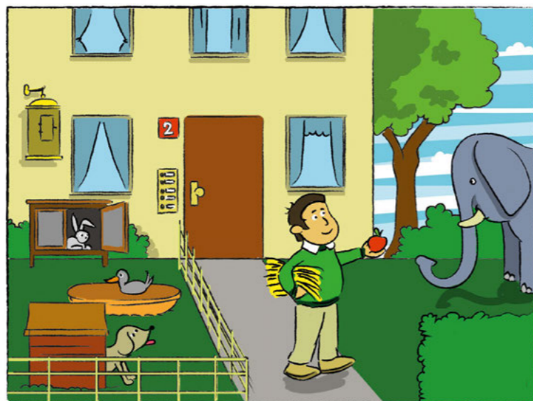
CARTOONS: PIOTR OBUCHOFF

Und auf den Kinderspielplätzen haben die tierischen Lieblinge, auch wenn sie angeleint sind, nichts zu suchen. •