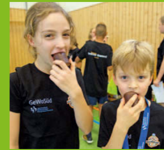
BEA-Kiezcamp > Seite 10