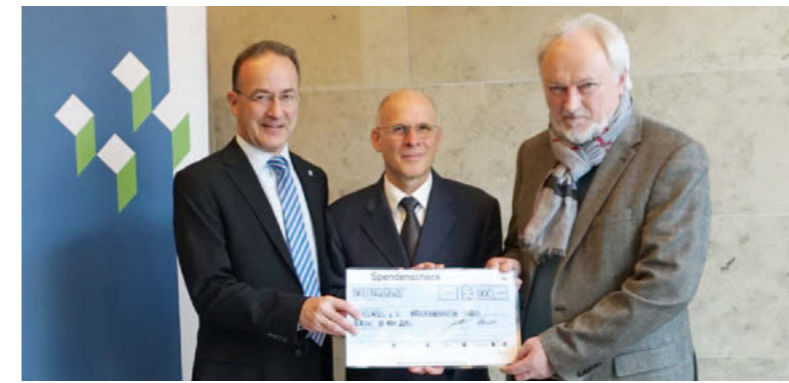
Eine Spende in die Dritte Welt

Als Reaktion auf das Editorial in der vergangenen Ausgabe des Mitglieder-Echos äußerte ein Mitglied den Wunsch, dass die Befürworter und Gegner der vorgeschlagenen Satzungsänderung sich verständigen sollten, ohne persönliche Angriffe und Vorwürfe. Für die weitere Diskussion wird es sicher von Vorteil für die Genossenschaft und ihre Mitglieder sein, wenn dieser Wunsch beherzigt und diese Diskussion sachlich geführt wird. •