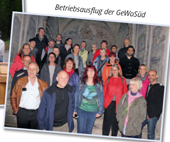
Betriebsausflug der GeWoSüd