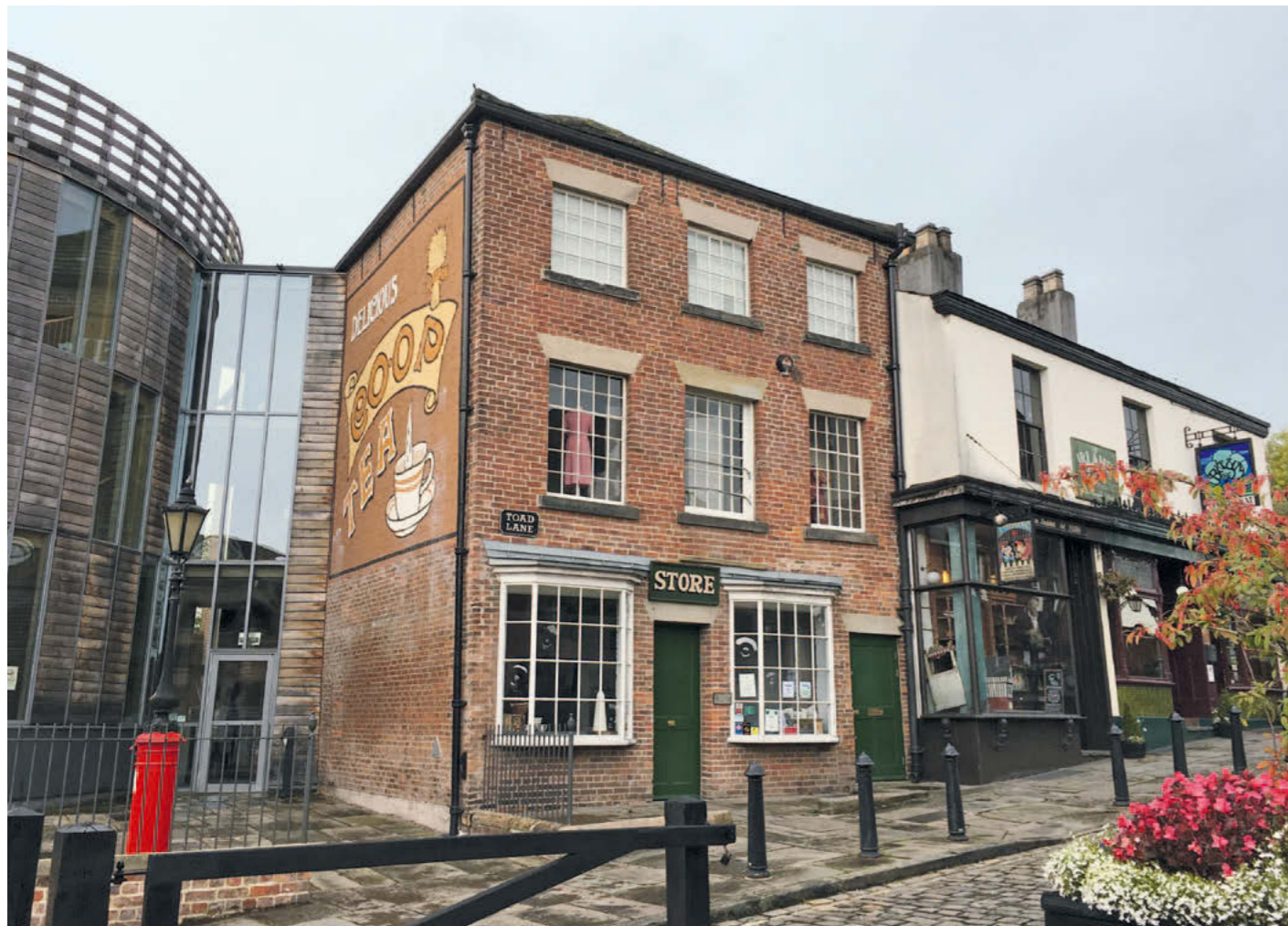
The Rochdale Society of Equitable Pioneers