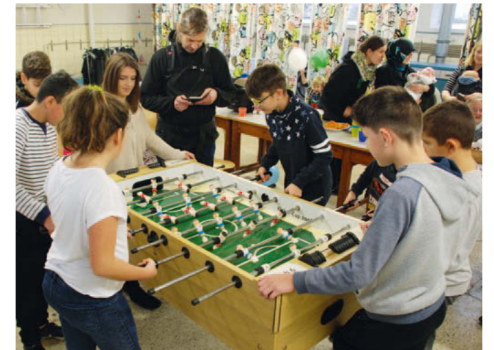
Begeisterung am neuen Kickertisch in unserer Wohnanlage in Neukölln

Ein großes Dankeschön gebührt nicht nur der Energieagentur, sondern auch den ehrenamtlichen Mitgliedern, die die Vorbereitung und Durchführung der Veranstaltung massiv unterstützt haben. •