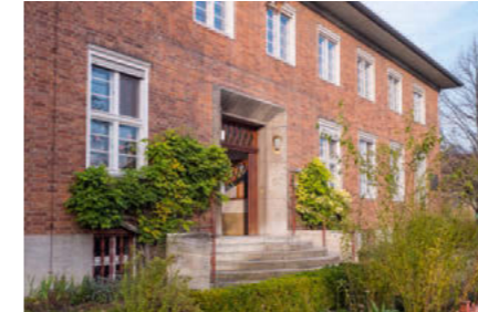
Gemeindehaus der St.-Annen-Kirche