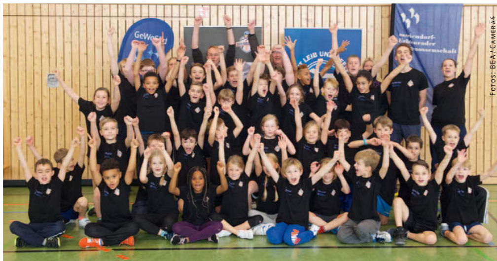
Gruppenfoto zum Abschluss

Die beiden „Most Efficient Player“ werden Ende Januar vor großer Kulisse in der Mercedes-Benz Arena bei einem Heimspiel von ALBA Berlin mit einem goldenen Basketball ausgezeichnet. Alle anderen Kinder bekommen für dieses Spiel Freikarten und können mit ihren Eltern und Geschwister auf der Tribüne Platz nehmen. •