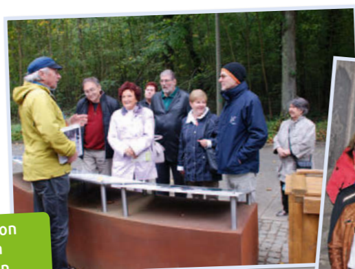
Ausflug der Ehemaligen

Fazit aller Teilnehmer: absolut sehenswert! •