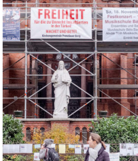
Protest gegen Unrecht – Gethsemanekirche

Gethsemanekirche Gottesdienste i. d. R. sonntags um 11 Uhr Es finden regelmäßig Konzerte statt Stargarder Straße 77 10437 Berlin-Pankow