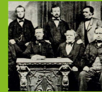
Redliche Pioniere > Seite 14