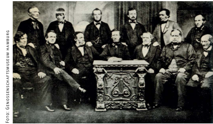
Die Redlichen Pioniere – als Zeichen der Verbundenheit legten sie dem Vordermann die Hand auf die Schulter

1844 schlossen sich 28 Weber zusammen, um sich in einer Form von Selbsthilfe gegen die damaligen Praktiken der Krämer-Läden zur Wehr zu setzen – die erste Genossenschaft war gegründet.