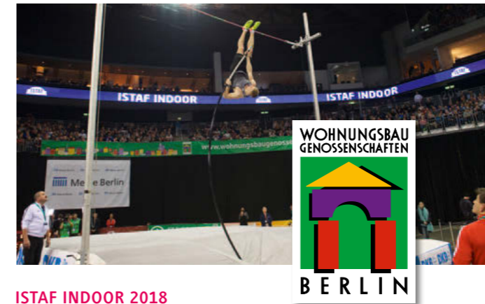
ISTAF INDOOR 2018

Die folgende Tabelle des Bundesministeriums für Gesundheit fasst die Leistungen zusammen. •