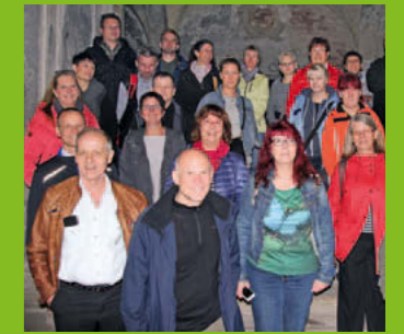
GeWoSüd-Ausflug > Seite 20