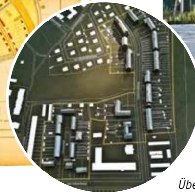
Häuserreihe „am Seegraben“