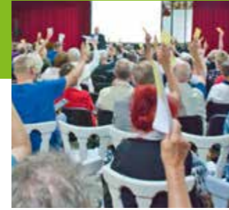
Mitgliederversammlung > Seite 4