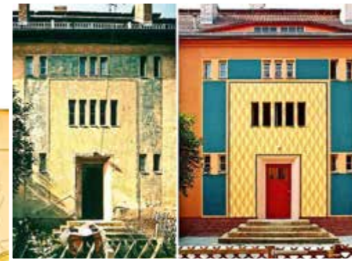
Gartenstadtweg 29, vor und nach der Sanierung