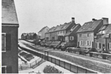
historische Gartenstadt Falkenberg