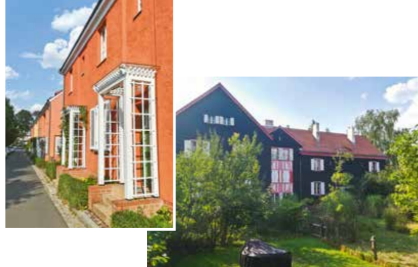
Häuser Akazienhof und Gartenstadtweg 86