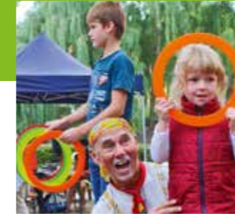
Parkfest 2018 > Seite 14