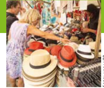
Märkte in Berlin > Seite 16