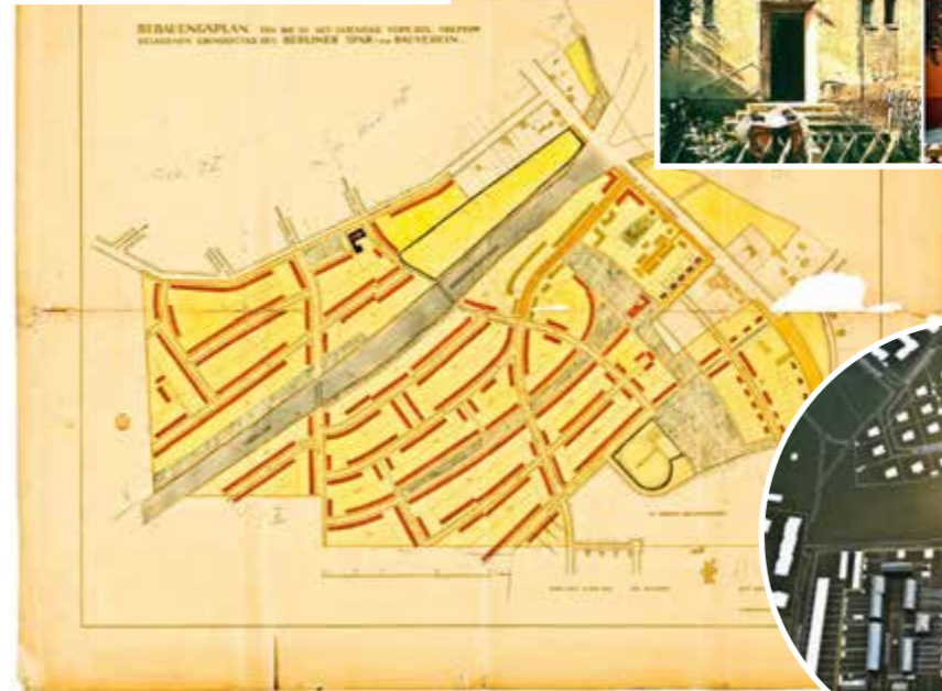
Bebauungsplan der Gesamtanlage der Gartenstadt Falkenberg