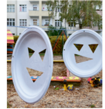
Porträt > Seite 15