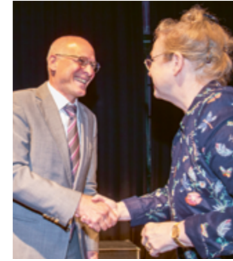
Auszeichnung > Seite 7