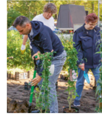
Pflanzaktion > Seite 11