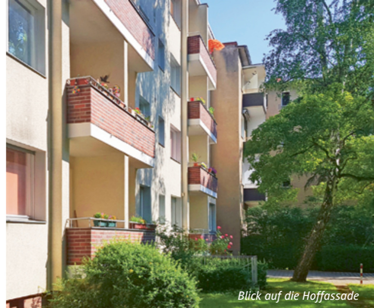
Blick auf die Hoffassade