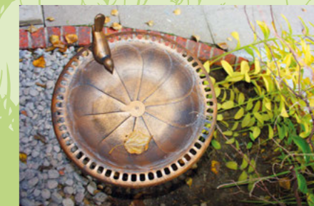
Togo-/ Ecke Transvaalstraße

Viele Funktionen auf wenig Raum formiert auf einem Höhengsprung, so präsentiert sich die etwa 700 Quadratmeter große Grünanlage in der Liebermannstraße im Bezirk Pankow. 2013 wurde die erhöhte Plattform noch einmal explizit herausgearbeitet und um einen Treppenzugang ergänzt. Im quadratischen Hof fällt Ende Oktober der Blick als erstes auf einen herbstlich gefärbten Walnusbaum, dessen Blätter den Boden gelb schmücken, die blattlose Zierkirsche und die imposante Kastanie. Den westlichen Abschluss bilden ein hinter Ligusterhecke versteckter Müllbereich und Fahrradstellflächen. Die Kehrtwende mit Blick auf die Wohngebäude entlockt einem dann doch noch ein kleines „oh, là, là“ und eröffnet einen Blick auf immergrüne Bodendecker sowie Hortensien und Spiräen direkt an der Hausfassade.